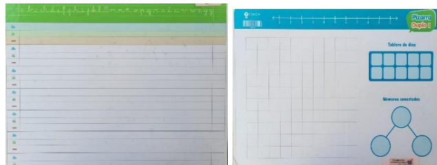
Imágenes de pizarra con carril caligráfico

¡Gracias por su colaboración y bienvenidos!