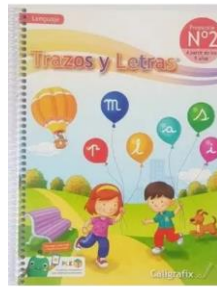
Imagen libro Trazos y letras