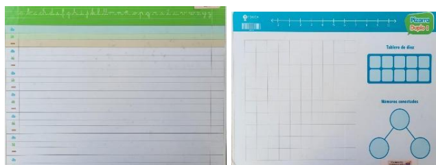
Imágenes de pizarra con carril caligráfico

¡Gracias por su colaboración y bienvenidos!