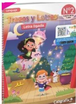
Imagen libro Trazos y letras N°2 Letra Ligada