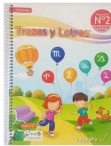
Imagen libro Trazos y letras