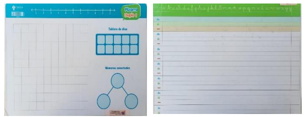
Imágenes de pizarra con carril

¡Gracias por su colaboración y bienvenidos!